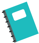
Un carnet de croquis/cahier

* Assure-toi de protéger ton espace de travail avec des journaux et de porter un tablier, les choses pourraient devenir un peu désordonnées !